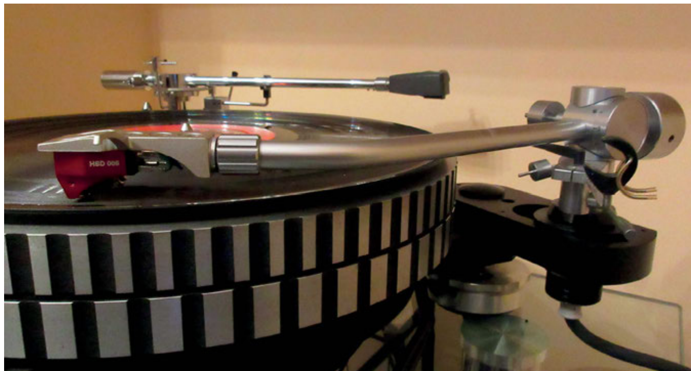
La testina montata sul braccio Fidelity Research FR-64; notare sullo sfondo il SAEC WE-308L. Bracci massicci di scuola giapponese degli anni '70, sono montati sul giradischi Micro Seiki DDX-1000, perfetto per prove a confronto.

Il montaggio della testina sullo shell si rivela agevole e veloce, anche perché il corpo della testina è dotato di fori filettati che ne rendono semplice e sicuro il fissaggio, evitando quei microscopici bulloncini che sfuggono tra le dita con estrema facilità; a proposito, l'uso dello shell da battaglia che si vede nelle foto è stato necessario visto