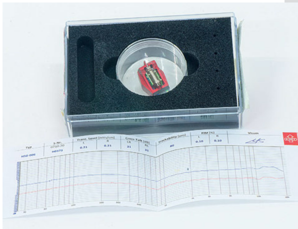
La confezione include un grafico con misure di risposta in frequenza e i risultati dei principali test effettuati in fase di collaudo del singolo esemplare.