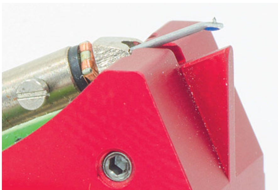
Nell'immagine ravvicinata si vedono gli avvolgimenti dell'equipaggio mobile e la puntina in diamante dal taglio SuperFineLine. Notare il caratteristico "naso" a protezione del cantilever.

che i gusci originali dei due bracci in mio possesso sono datati e hanno i piccoli fili e i pin delicati e fragili, ciò sarebbe stato di impedimento ai montaggi, rimontaggi e regolazioni varie necessari durante la prova, spero che ciò non abbia influito più di tanto sul suono.